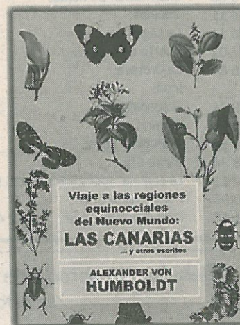
Portada del volumen. / DA

varias tablas cronológicas sobre el investigador alemán, tanto de su biografía como de su presencia en Canarias. Humboldt y Bonpland, después de ver frustrados varios proyectos, comenzaron en junio de 1799 un viaje que tenía como destino las colonias españolas en América, los científicos zarparon del puerto de La Coruña en la corbeta Pizarro . La travesía por el Atlántico se prolongó durante 40 días, incluyendo en ellos los trece que tardó la nave Pizarro en llegar desde La Coruña hasta Tenerife. A su llegada a Canarias Humboldt y Bonpland visitaron la Graciosa.